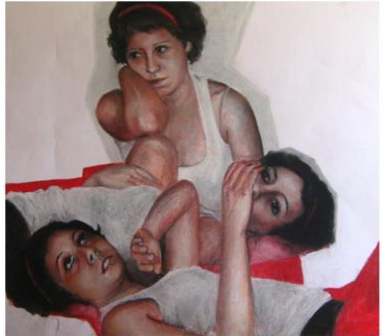
The beauty of the game "Multiplce Janall" 80X80