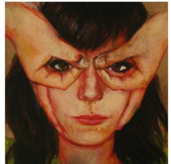
Ikhe bauty of the mask "Super girl" 20X20