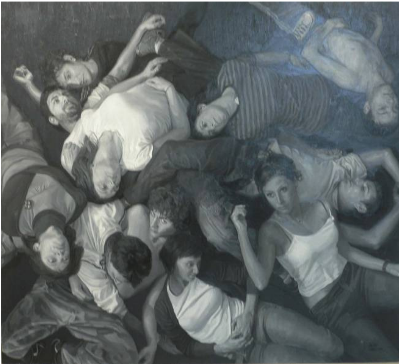
Manolo Antolí "Con la Mirada de un perro" 198X198