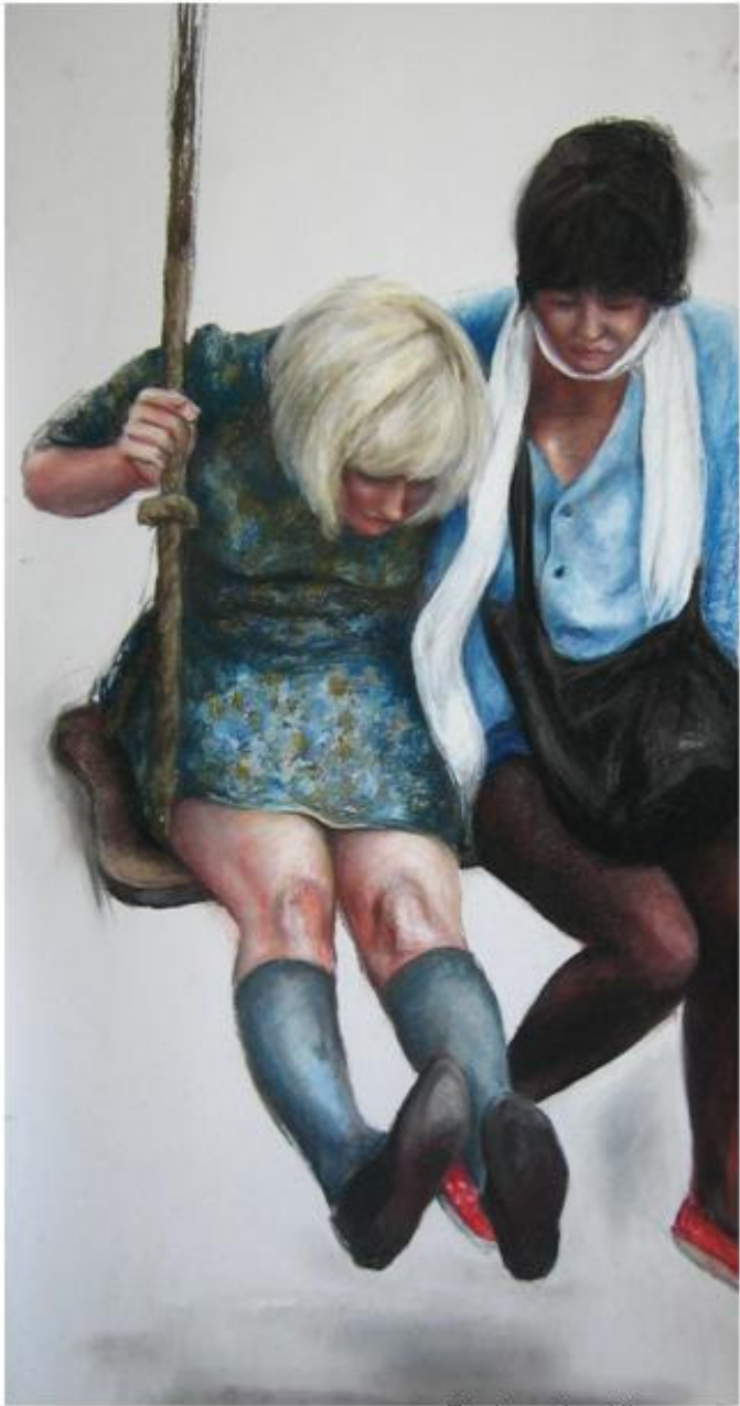
The beauty of the game "Mrs. Kingdom swing" 1.50X60