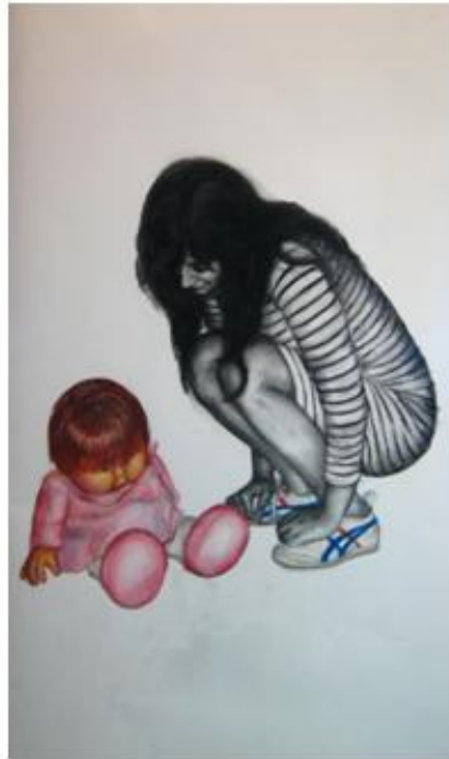
The beauty of the game "Girl and doll" 1.40X73