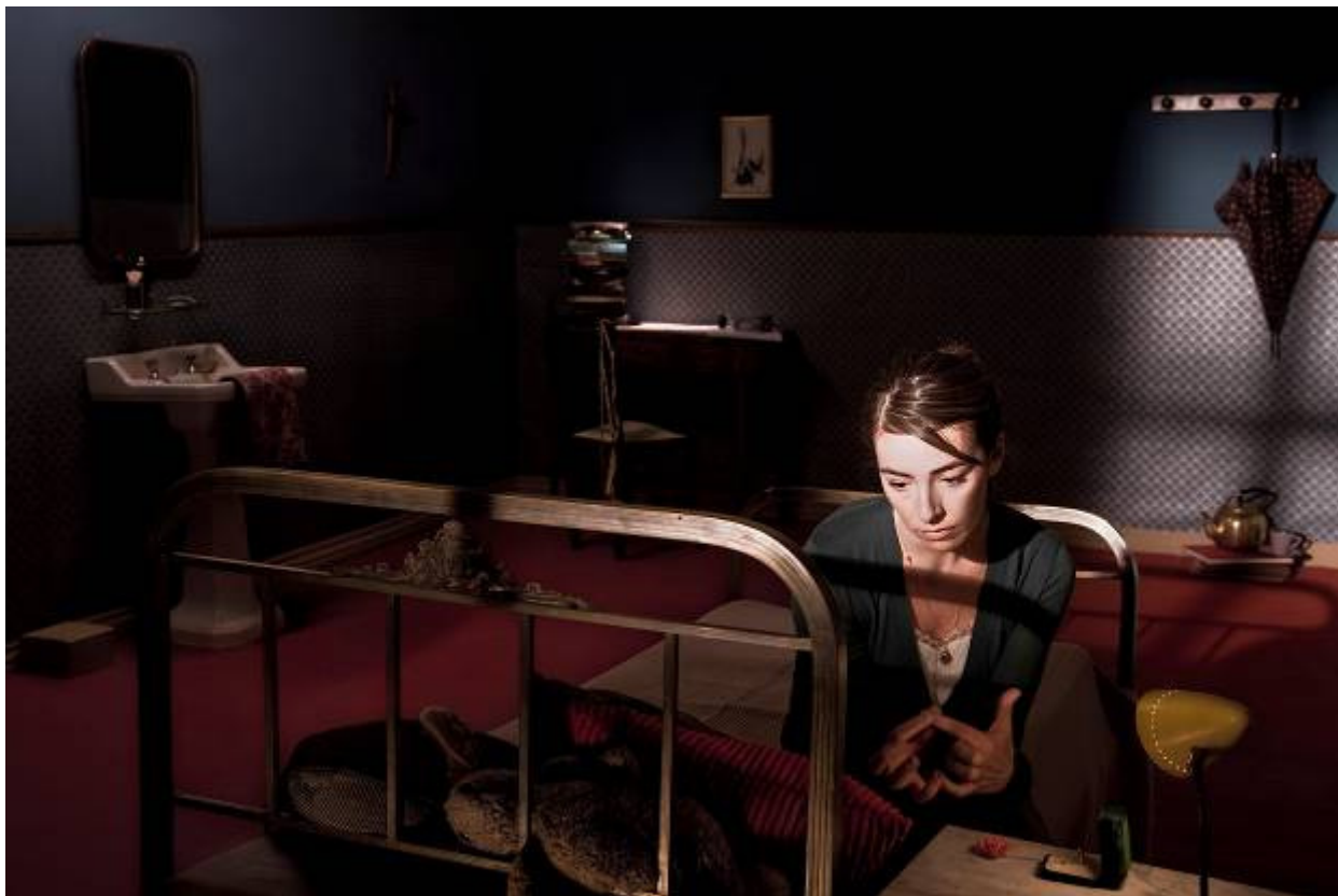
Grace Smith . Fotografía digital. Lambda print 120X80 cms