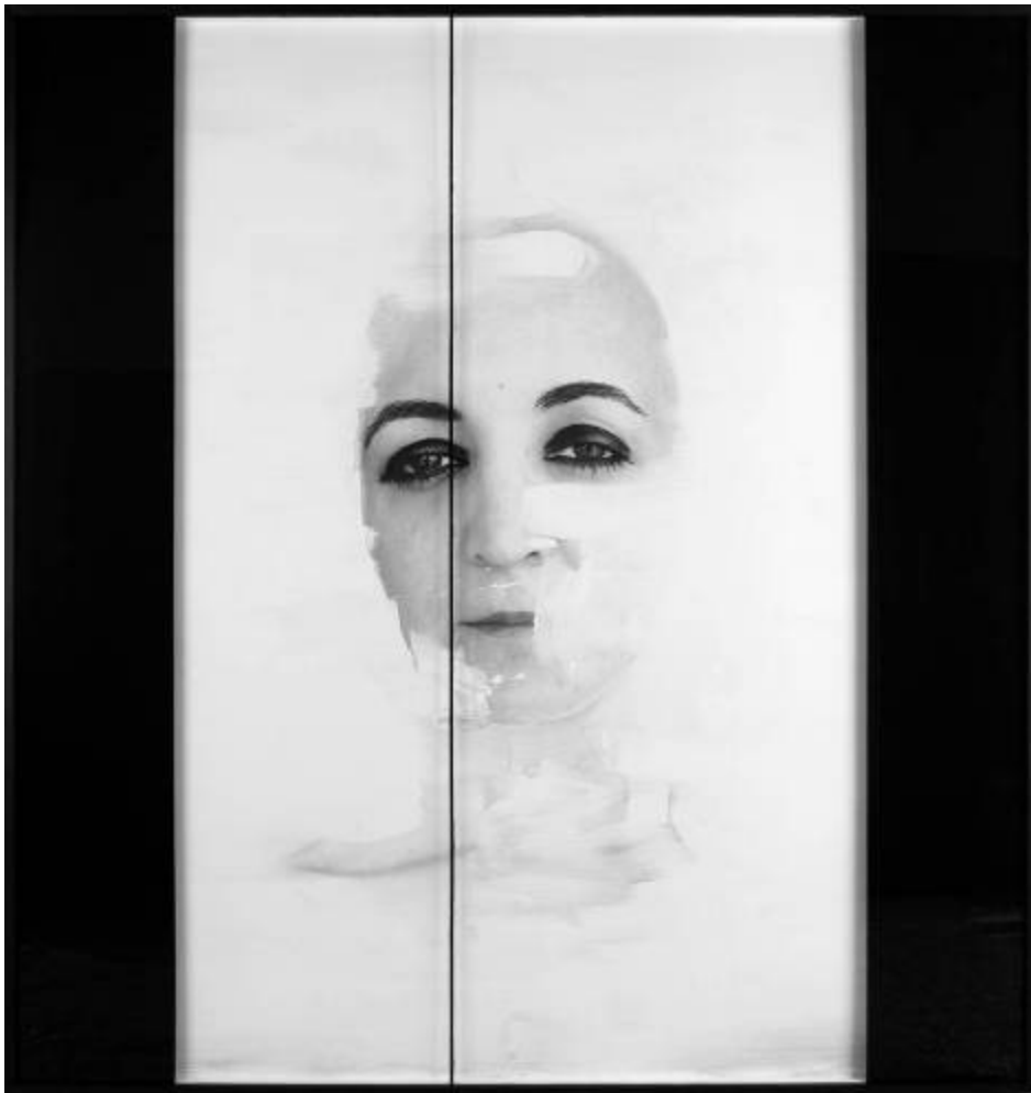
"Lánguidos tus ojos" Fotografía y técnica mixta 163 X 163 cm

Construyendo y manipulando insólitos escenarios, sus siluetas recuerdan a aquella experimentación fotográfica reivindicada por los constructivistas, los fotogramas de Man Ray, los experimentos con la luz de Moholy Nagy en el Design Institute of Chicago, los collages fotográficos surrealistas, los trabajos de Hockney o Jan Hendriks e incluso la utilización de materiales fotográficos utilizados por los artistas conceptuales.